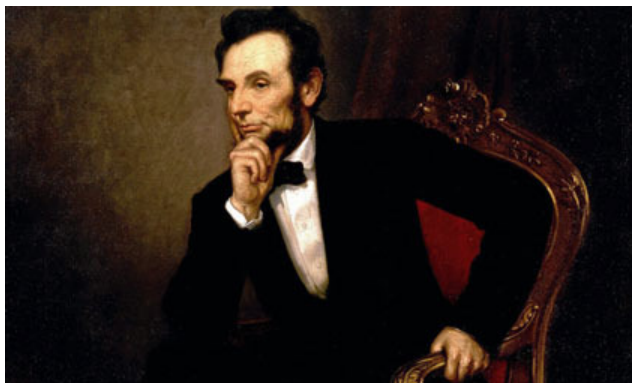
อับราฮัม ลินคอล์น (Abraham Lincoln)

“ถ้าให้เวลาข้าพเจ้า 6 ชม. ในการตัดต้นไม้ซักต้น ข้าพเจ้าจะใช้ 4 ชม. แรกไปกับการลับคมของขวาน”